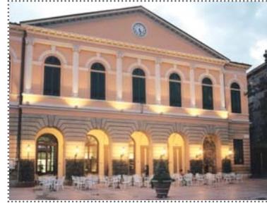
Palazzo delle Terme di Casciana